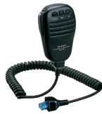
MH-31A8J ダイナミック マイクロホン (付属品と同等) 標準価格 3,700円 (税抜)