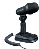
M-100 デュアルエレメント マイクロホン 標準価格 42,800円 (税抜)