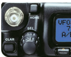
フロントパネル(BNC型)

フロントパネル面(BNC型)と背面(M型)の2つのアンテナ端子を装備し使用バンドと状況に応じた効率の良い運用が可能です。付属のホイップアンテナを前面のBNC端子に装着すれば気軽にハンディー感覚で移動運用が楽しめます。運用バンド毎に最適なアンテナ端子をメニューモードより選択ができます。