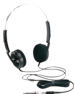
YH-77STA ステレオヘッドホン 標準価格 5,700円 (税抜)