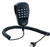
MH-36E8J DTMF マイクロホン 標準価格 9,500円 (税抜)