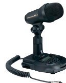
M-1 リファレンス マイクロホン 標準価格 74,800円 (税抜)