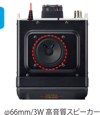
φ66mm/3W 高音質スピーカー

3Wの高音質・大音量の内蔵スピーカーを採用していますので、高品位で明瞭度の高い受信音質で通信を楽しむことができます。オーディオ回路には独自のチューニングが施されており、騒音の激しい屋外の使用でもクリアで快適な交信が可能です。